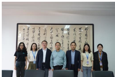
(文院领导考察常熟中学实习情况)