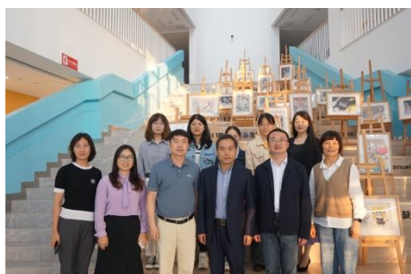
(文院领导考察南航附中实习情况)