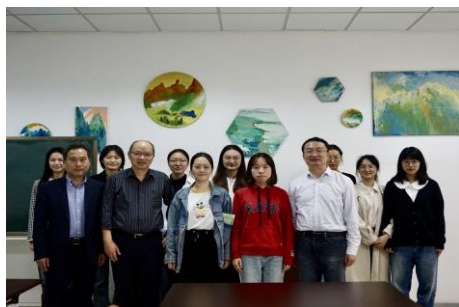
(文院领导考察西交附中实习情况)