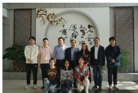
(文院领导考察相城实验中学实习情况)